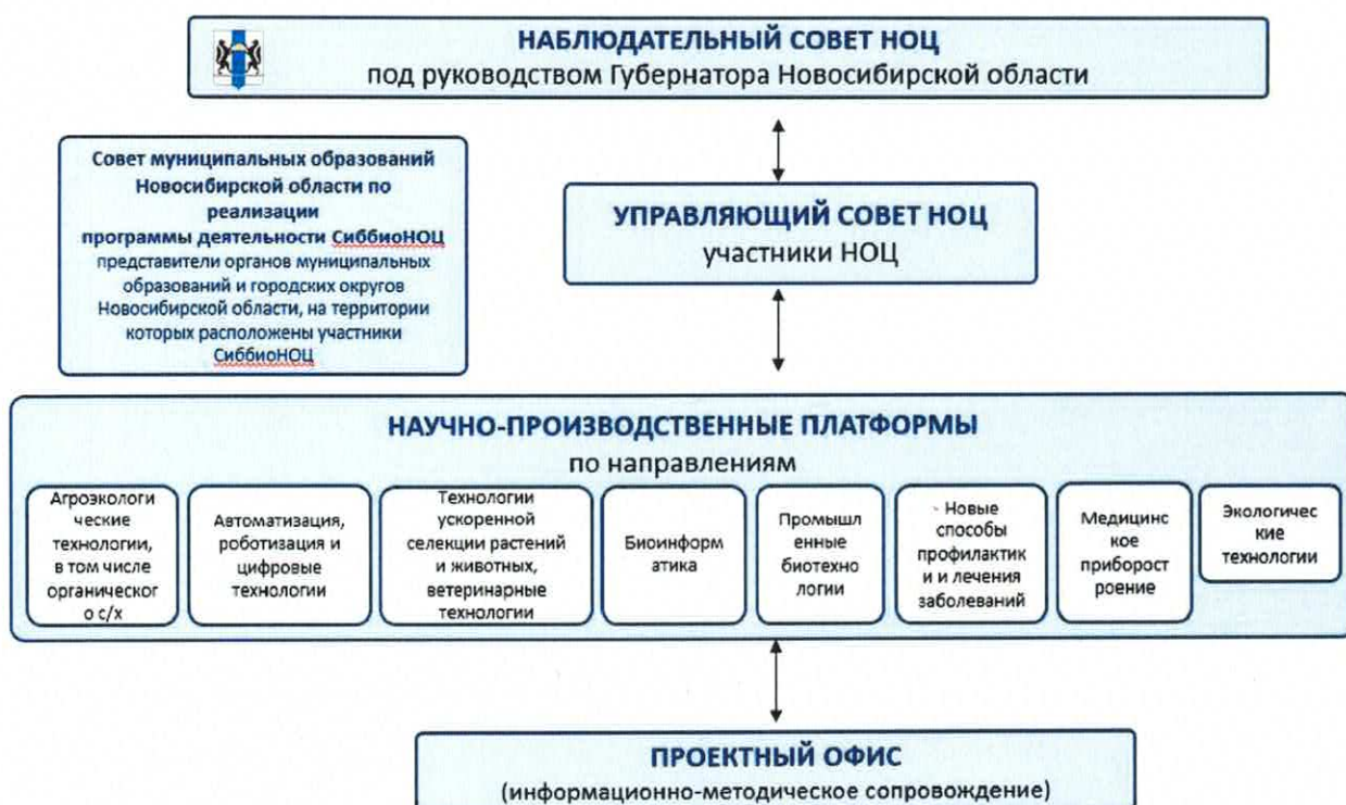
Рис.1. Механизм управления СиббиоНОЦ

Постановлением Губернатора Новосибирской области от 03.11.2020 № 201 «О наблюдательном совете научно-образовательного центра мирового уровня «Сибирский биотехнологический научно-образовательный центр» сформирован коллегиальный совещательный орган управления СиббиоНОЦ – Наблюдательный совет «Сибирский биотехнологический научно-образовательный центр» (далее – Наблюдательный совет). Наблюдательный совет утверждает программу деятельности СиббиоНОЦ и осуществляет мониторинг ее реализации, при необходимости по согласованию с Советом научно-образовательных центров мирового уровня вносит в нее изменения (схема представлена на рис. 1).